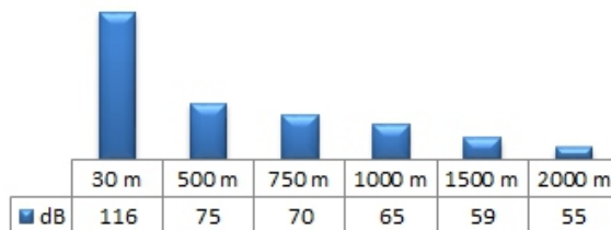
Zasięg akustyczny przy średnim poziomie hałasu (70 dB) panującym w mieście i dookólnym rozstawieniu głośników (180°)

Słyszalność syreny elektronicznej DSE-1500S jest w największym stopniu uzależniona od poziomu hałasu otoczenia oraz od ukształtowania terenu. Moc i liczba syren potrzebnych do odpowiedniego nagłośnienia obszaru powinny być uzależnione od zabudowy terenu i panujących tam warunków atmosferycznych, które mogą powodować tłumienie dźwięku.